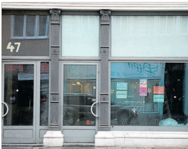
Ein Beispiel von vielen: Leere Schaufenster in der Friedrich-Wilhelm-Straße. Eine Leerstands Börse und Konzepte für eine zwischenzeitliche Nutzung sollen die Trendwende bringen.

Das Friedrich-Wilhelm-Viertel mit seiner Nähe zur berühmten Bruchstraße sowie Braunschweigs Altstadt im Bereich zwischen Langer Straße und Martini-Kirche sowie Schützen- und Gildenstraße sind von der innerstädtischen Entwicklung abgehängt worden. Die Schwerpunkte haben sich verlagert, es wird immer schwieriger, gute Mieter zu finden. Von „Trading-down-Effekten“ wird gesprochen, wenn Ladenlokale nur noch für Spielhallen oder Sexläden zu taugen scheinen. Oder wenn sich überhaupt niemand für sie interessiert. Was dagegen unternommen werden soll, steht auf Seite 3.